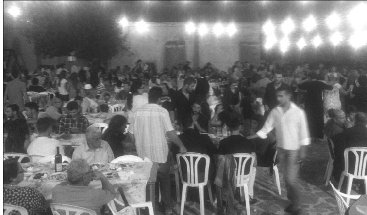
Από την εκδήλωση της κρητικής βραδιάς.

• Στις 7 Αυγούστου διοργανώθηκε απογευματινός περίπατος στην εκκλησία του Αγίου Ιωάννου του Θεολόγου στο Επάνω Χωριό. Τελέστηκε εσπερινός και στη συνέχεια παράκληση με αρτοκλασία.