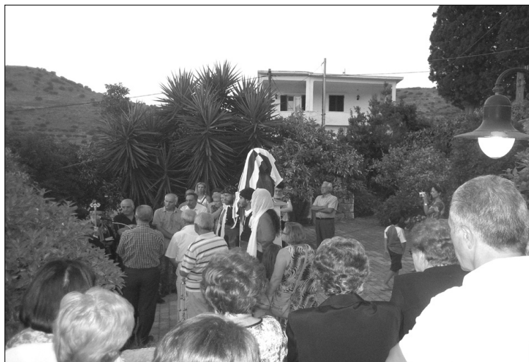
Στιγμιότυπο από την τελετή

Σήμερα εμείς εδώ συγκεντρωθήκαμε για να τιμήσουμε τον αγωνιστή Κωνσταντίνο Μπέμπελη, ο οποίος έχοντας ως βάση τη φουρνιώτικη γη, που τον γέννησε, συνέβαλε και αυτός με τη δράση και την αγωνιστικότητα του στην απελευθέρωση της Κρήτης και την ένωση της με την υπόλοιπη Ελλάδα. Νιώθουμε την ηθική υποχρέωση ως άνθρωποι και ως συγχωριανοί του, καθώς και έναντι των άλλων συγχωριανών μας